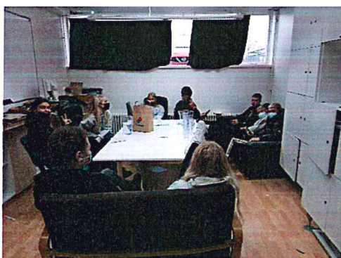
Mynd 3 Forsvarsfólk nemendafélagsins fundar

Félagslíf nemenda er mikilvægur þáttur í starfi Menntaskólans við Sund en á tímum samkomubanns hefur það verið afar takmarkað. Nemendur náðu að halda árshátíð sína í febrúar 2020 en eftir að samkomutakmarkanir vegna sóttvarna voru settar á var ekkert formlegt félagstarf á skólaárinu. Haustið 2020 tók skólinn þá ákvörðun í samráði við stjórn SMS að bjóða nýnemum á skemmtikvöld í minni hópum í nýnemavikunni. Reynt var að skapa félagslíf og stemmingu innan þeirra stífu ramma sem sóttvarnareglur settu, nemendur héldu útvarpsviku sem heppnaðist mjög vel auk þess sem hlaðvarp og aðrir rafrænir kostir voru prófaðir, m.a. í samstarfi við foreldraráð skólans. Í desember voru haldin skemmtikvöld fyrir nýnema með jólaívaði þar sem eldri nemendur sáu um að skemmta nýnemum í litlum hópum inni í kennslustofum.