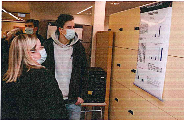
Mynd 2 Kynning á lokaverkefnum

Stefna skólans kallar á námsvenjur þar sem ábyrgð nemenda á eigin námi, mæting, virkni og þátttaka gegna lykilhlutverki. Mikilvægt er að nemendur vinni jafnt og þétt, ástundi heiðarleg vinnubrögð og þjálfni með sér þrautseigju. Skólinn hvetur kennara til nýbreytni- og þróunarstarfs þar sem horft er bæði til innihalds náms og námsumhverfis. Í öllum áfangalýsingum í MS koma fram þekkingar, leikni og hæfnimarkmið sem unnið er út frá en í námsáætlun hvers áfanga kemur fram nánari útfærsla á náms- og kennsluháttum.