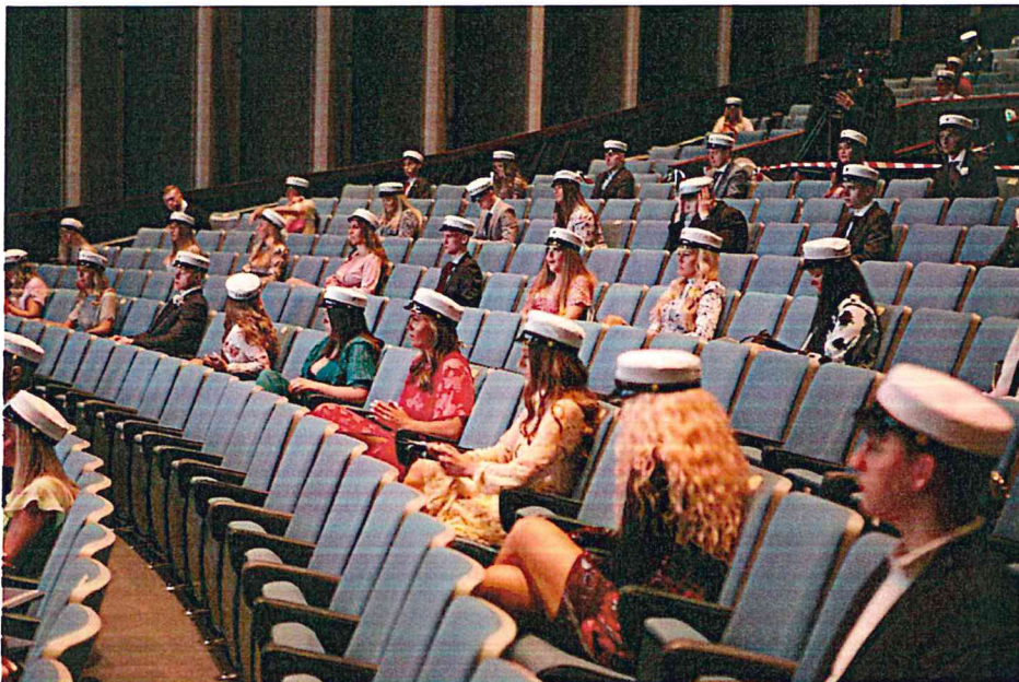
Mynd 1 Útskrift vor 2020

Skólaárið er skipulagt á þrjár annir og í samræmi við það geta nemendur sótt um skólavist þrisvar á ári og einnig útskrifar skólinn nemendur þrisvar á ári. Árið 2020 útskrifaði skólinn 181 nemanda. 143 nemendur luku námi á þremur árum eða 9 önnum. Á vetrarönn 2019-20 voru fimm nemendur útskrifaðir, einn þeirra var að ljúka námi eftir 8 annir en fjórir höfðu stundað nám lengur, 3 í 11 annir og 1 í 13 annir. Á haustönn 2020 útskrifaði skólinn 18 nemendur. Tveir þessara nemenda luku námi á 9 önnum, þ.e. á tilskildum tíma og níu nemendur luku námi á 10 önnum. Hinir sjö luku námi á lengri tíma.